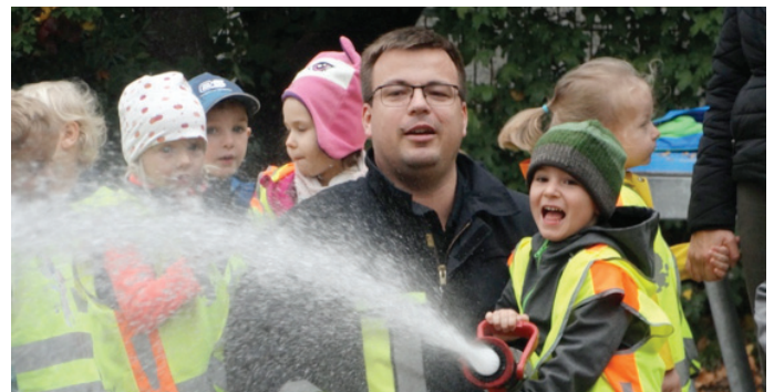
Für die Kinder ein großes Erlebnis: Einmal mit einem echten Feuerwehrschlauch Wasser spritzen.

In den vergangenen Wochen war viel los im Kindergarten Storchennest. Unter anderem hat im Oktober eine Woche zum Thema Brandschutz stattgefunden. Die Kinder konnten anhand von Bilderbüchern, Liedern, Spielen und Gesprächen im Morgenkreis tief in die Welt der Feuerwehr eintauchen. Ein Highlight für die „Hasen“ war