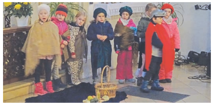
Endlich konnten die Kinder wieder ein Sankt-Martins-Spiel in einer vollen Kirche vorführen.

len konnten. Der Elternbeirat verköstigte alle Gäste mit Würstchen, Käsesemmel, Lebkuchen, Punsch und Glühwein. Es war ein gelungenes Fest. Ein herzliches Dankeschön geht an die Gemeinde für die Brötchen, an die Feuerwehr für den geregelten Ablauf und an den Elternbeirat für die Verköstigung.