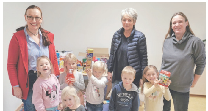
Bei der Übergabe staunten die Kinder nicht schlecht, als sie sahen, was für Köstlichkeiten in die Kisten gepackt wurden.