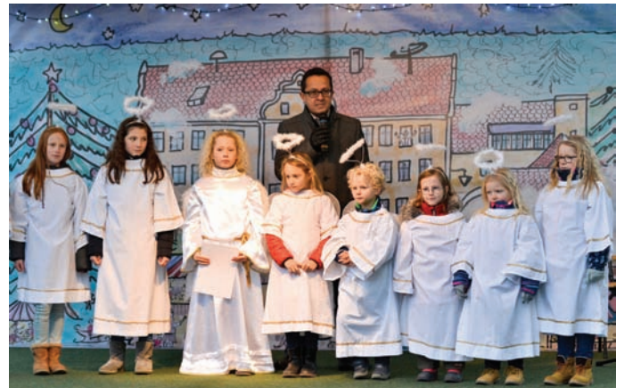
Der geplante Weihnachtsmarkt soll heuer wieder am Schloss stattfinden, falls die Pandemie es zulässt.

Reichertshofen – Neuigkeiten zum geplanten Weihnachtsmarkt 2022 und ein paar Finanzspritzen für Vereine gab es auf der letzten Sitzung des Reichertshofener Kulturausschusses. Die Ausschussmitglieder waren sich bei allen Tagesordnungspunkten einig.